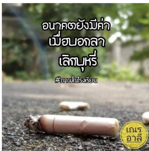
รูปที่ 1 ภาพโฟโต้วอยซ์ในโรงเรียนจากสามเณรแกนนำ Figure 1 Photovoice photo in school from novice leader

หลังจากที่ได้รับการคืนข้อมูลเกี่ยวกับพฤติกรรมกรรมการสูบบุหรี่ของสามเณรนักเรียนในโรงเรียนที่ทำกรวิจัยและโรงเรียนข้างเคียงจากงานวิจัยในปีการศึกษาที่ผ่านมา ทำให้สามเณรแกนนำเริ่มรับรู้จำนวนสามเณรนักเรียนที่สูบบุหรี่มีปริมาณมาก ดังนั้นการถ่ายภาพโฟโต้วอยซ์เกี่ยวกับการสูบบุหรี่ในวัด โรงเรียน และชุมชน จึงเป็นการเริ่มต้นให้สามเณรแกนนำค้นหาปัญหาเกี่ยวกับการสูบบุหรี่ด้วยตนเอง ซึ่งจากภาพโฟโต้วอยซ์ พบว่ามีเศษบุหรี่และซองบุหรี่ที่ถูกทิ้งไว้ทั้งในวัด โรงเรียน และชุมชน ดังรูปที่ 1 และ 2