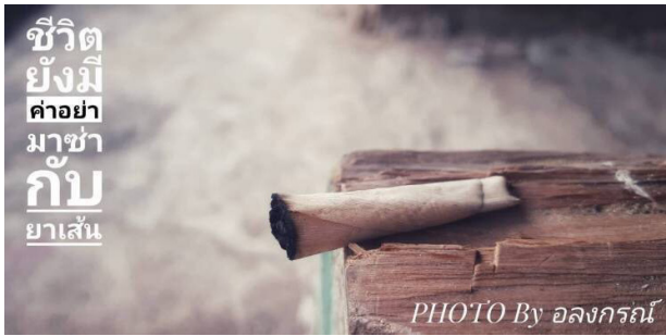
รูปที่ 5 ภาพที่ถ่ายด้วยกล้องจากสามแฉกรุ่นนักเรียน